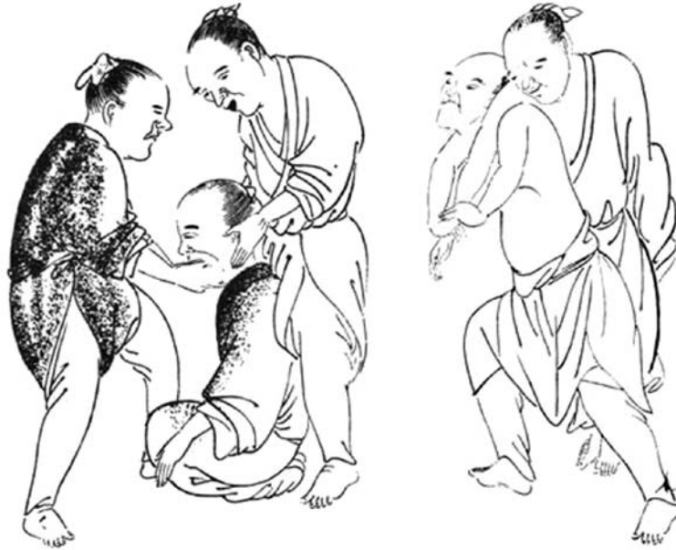
図3 華岡青洲整復図

左図は頸関節脱臼整復法を示し、現在でもこれと同様の手法が用いられている。右図は肩関節脱臼整復法を示し、柔道技の背負い投げを連想させる。このような“この原理”を応用した整復法には改良が加えられ、現在でも類似の方法が用いられている（文献9）から引用。