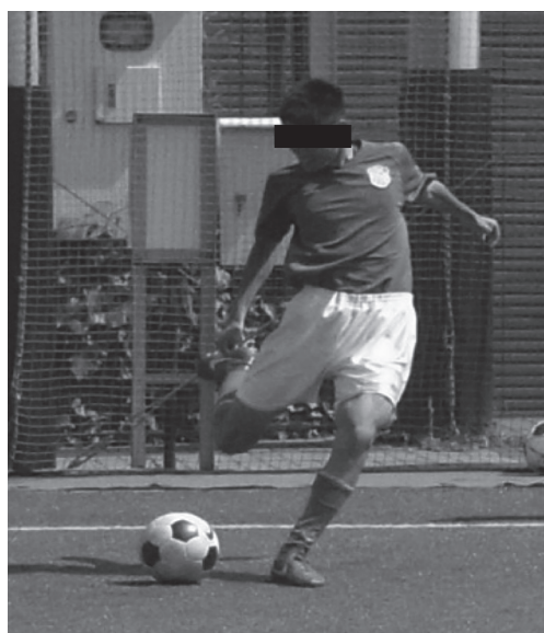
図3 ボールキック時の姿勢 非利き足側でバランスを取りキック動作を行っている。